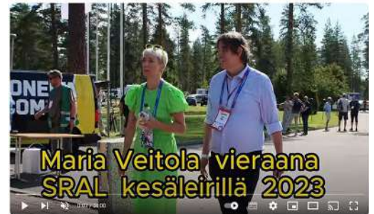
Maria Veitola vieraana SRAL Leiri 2023